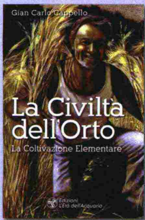
“La civiltà dell'orto. La coltivazione elementare” GIAN CARLO CAPPELLO - 188 PAGG. L'ETÀ DELL'ACQUARIO - 19 €

La coltivazione elementare, secondo l'autore, è la realizzazione più avanzata della filosofia del «non fare», concepita ormai mezzo secolo fa dal contadino giapponese Masanobu Fukuoka. Essa rivisita con creatività ed estemporaneità nel contesto di per sé perfetto della Natura l'esperienza di una ruralità tramandata di generazione in generazione. Se la tecnologia ci rende dipendenti dalla razionalità allontanandoci dalla nostra vera dimensione naturale, la coltivazione elementare ci può affrancare dai disastrosi tentativi dell'umanità di controllare la vita. Nei processi naturali c'è già la ricchezza per ottenere con ottimi raccolti l'autosufficienza alimentare delle comunità. La nostra esistenza si può allineare alla perfezione imperscrutabile che è dentro di noi.